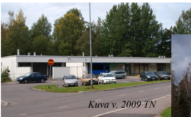
Kuva v. 2009 TN

Koska alueemme asukasluku suurenee ja ikärakenne muuttuu, on perusteltua, että asujaimistolle tärkeät palvelut säilyvät vähintäänkin nykyisellä tasolla. Terveysaseman siirto Kilon myöhentyy koronaviruksen johdosta, mutta sen lopullista siirtoa emme voi missään nimessä hyväksyä.