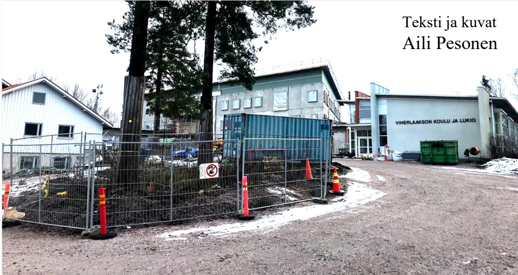
Teksti ja kuvat Aili Pesonen