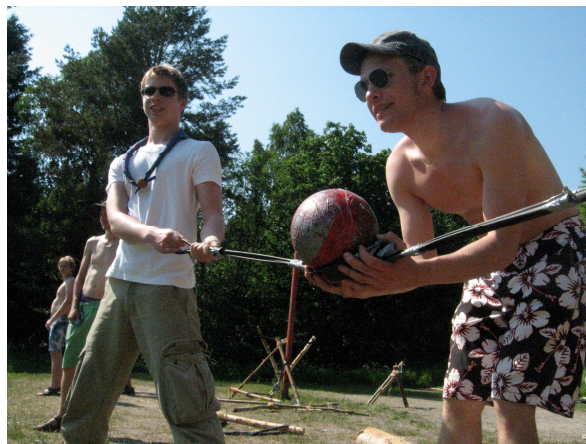
Live Angry Birds -peli vauhdissa viime kesän johtajaleiri Vimmalla

Uusia jäseniä halutaan mukaan siksi, että toimintaa olisi jatkossakin, mutta myös siitä syystä, että partioharrastus on yksinkertaisesti niin siistiä! Olisi sääli, jos lippukunnan pieni koko estäisi kiinnostuneita tulemasta mukaan ja kokemasta kaiken sen, mitä partio parhaimmillaan voi antaa.