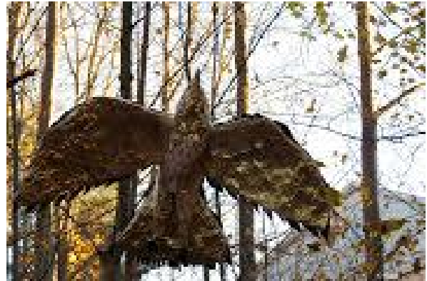
Tekijä tuntematon taiteilija yläkoulun puolelta

Omaehtoinen ympäristön kaunistaminen toteutui myös syksyisellä taidepolulla ala- ja yläkoulun välisessä metsikössä, jossa tarkkaavainen kulkija saattoi huomata puussa tai maassa oppilaiden taiteilemia lintuja ja hyönteisiä. Kiva idea! Tässä muutama esimerkki. TN