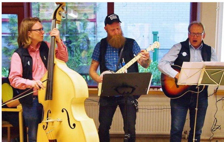
Helmetin Enkelit musisoivat kirjastossa taas Viherlaakso-päivänä.