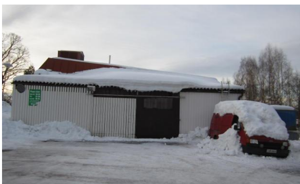
Ennen remonttia rakennuksen päätyä koristivat jätekatokset, töherrykset ja hylätyt autot.

Nykyisessä, v. 1983 rakennetussa kiinteistössä toimivat sittemmin K-ketjun ruoka-kaupat Viherhalli ja K-extra ja tämän jälkeen kirpputori n. vuoteen 2012 saakka. Rakennus oli vuosien saatossa päässyt huonoon kuntoon, ja uhkasi pilata kylän viihtyvyyttä