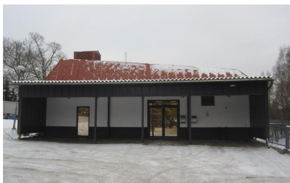
Rakennuksen korjaamista on paikallisesti luonnehdittu ympäristöteoksi.

Viherlaaksolaiset ry:n puolesta on seurattu aktiivisesti kunnan kaavoitustoimia mm. asemakaavoituksen puolesta, jolla on ratkaiseva merkitys alueelliseen kehitykseen.