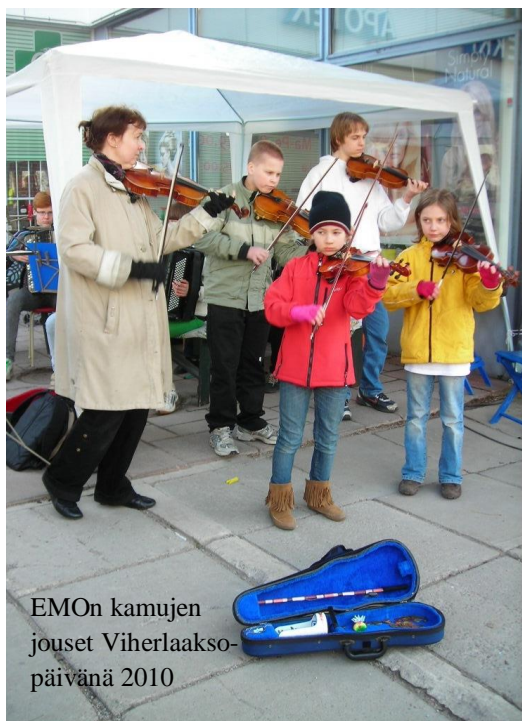
EMOn kamujen jouset Viherlaakso- päivänä 2010